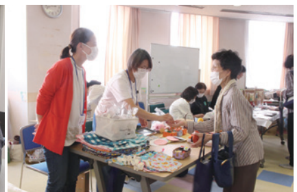
手づくり品の販売。