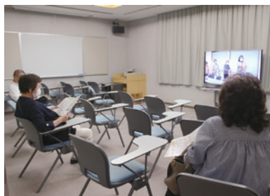
活動紹介動画の上映。

福祉当事者団体・ボランティアグループの活動紹介や地域福祉社会活動の様子を上映する上映エリア、手づくり品・授産製品などを販売する販売エリア。