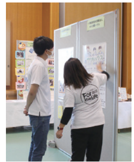
参加団体の、活動を伝えるパネル。

展示エリア、発表エリアでボランティアグループや関係団体、福祉医療団体の活動を紹介します。