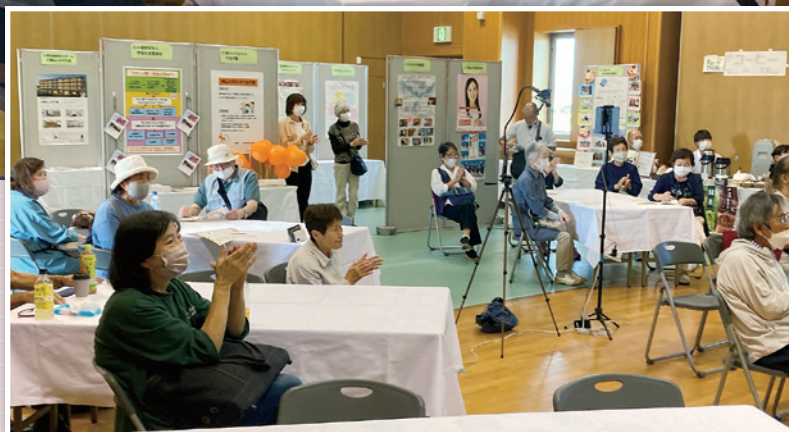
表紙：ふれあい福祉まつり (P6)