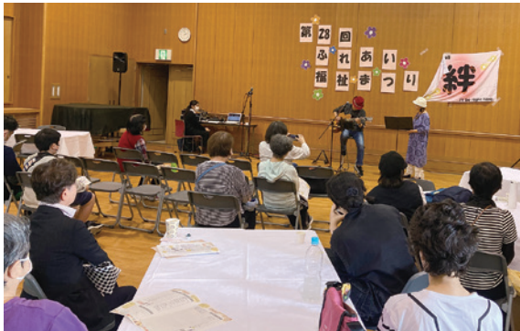
発表エリアには喫茶コーナーも登場 珈琲を飲みながら、各団体の発表を鑑賞。

「たすけai(あい) ささえai(あい)のまち くみやま」をテーマに開催したふれあい福祉まつり。第28回を迎えた今年は久御山町ふれあい交流館ゆうホールの2階・3階を会場に、久御山町内でさまざまな活動をされている各関係団体、ボランティアグループ、医療・福祉施設の活動を紹介しました。