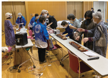
発表後に大正琴の演奏体験。