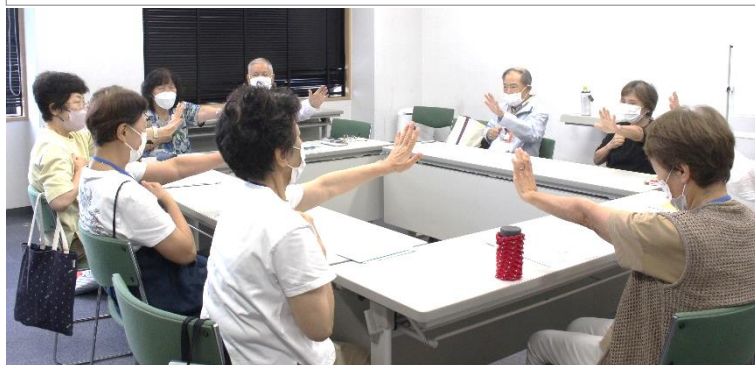
月に一回の定例会で活動報告と反省会。ゲームの復習も行う。